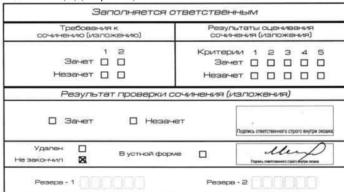
Рис. 10. Заполнение полей нижней части бланка регистрации (завершение написания сочинения (изложения) по уважительным причинам)

Внесение отметки в поле «Не закончил» подтверждается подписью члена комиссии по проведению ИС(И) (см. рис. 10).