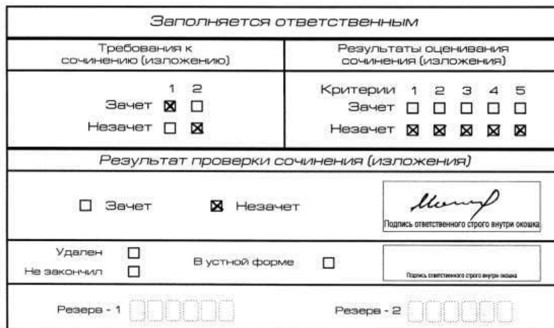
Рис. 7. Область для оценки работы

Если ИС(И) соответствует требованию № 1 и требованию № 2, то выставляется «зачет» за выполнение требования № 1 и требования № 2. Указанные сочинения (изложения) далее оцениваются по критериям.