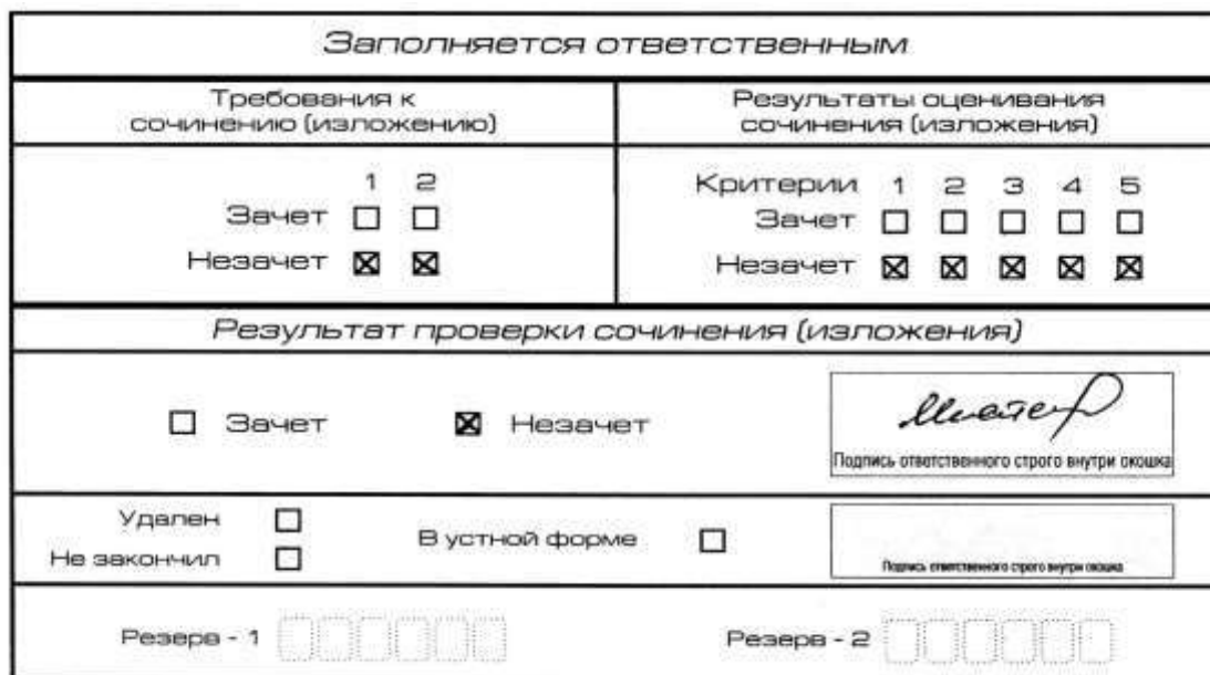
Рис.6. Область для оценки работы