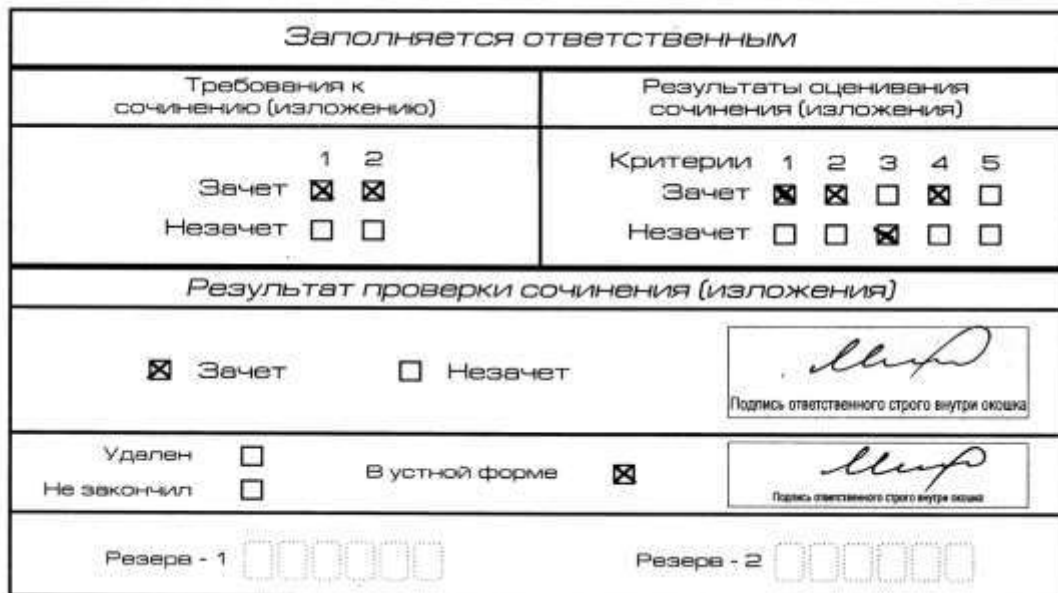
Рис. 9. Область для оценки работы сочинения (изложения) в устной форме