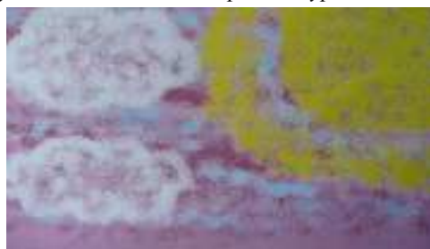
работа ученицы 6 "Б" класс

10. Подбор художественного ряда . Детям предлагается подобрать произведения живописи, созвучные услышанному произведению. Эта работа может быть оформлена на компьютере в качестве слайд-шоу.