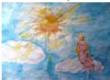
работа ученицы 6 «В» класс

«На неверных весах моей души» из кантаты «Кармина Бурана»